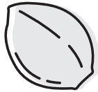
des graines de cannabis